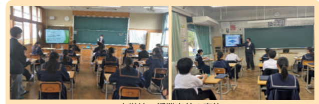
中学校へ授業出前の実施