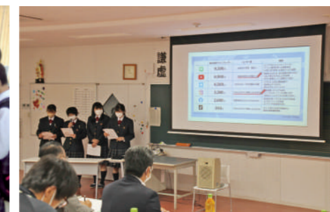
課題研究の様子(地域興し)