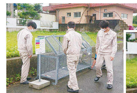
天城町との連携によるフィールドワーク学習の一環としてゴミステーションを製作し設置