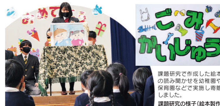
課題研究で作成した絵本の読み聞かせを幼稚園や保育園などで実施し寄贈しました。 課題研究の様子(絵本製作)