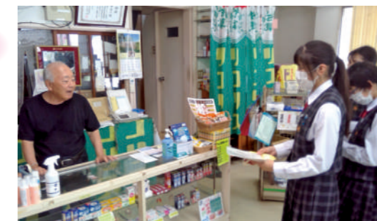
商店街の方へのインタビュー